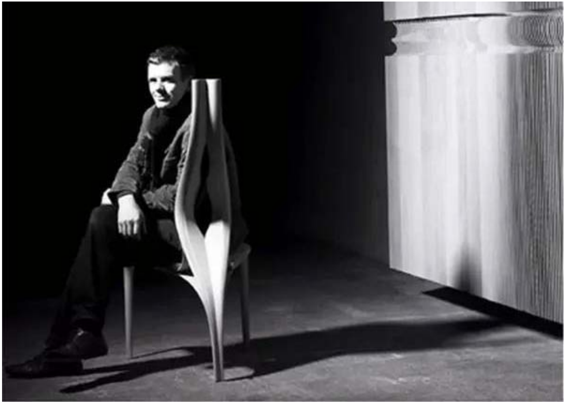
▲设计师 Joseph Walsh 近照

曲线设计元素常用在设计中，那么当曲线邂逅家具，会碰撞出怎样的火花？爱尔兰设计师 Joseph Walsh 就以创新的技艺，给予木材更多的灵性。生于 1979 年的 Walsh，运用创造性的方法表现自然之美，也让使用者用视觉和触觉发现产品之美。流畅的线条、飘逸的造型，家具也有了灵动之感。