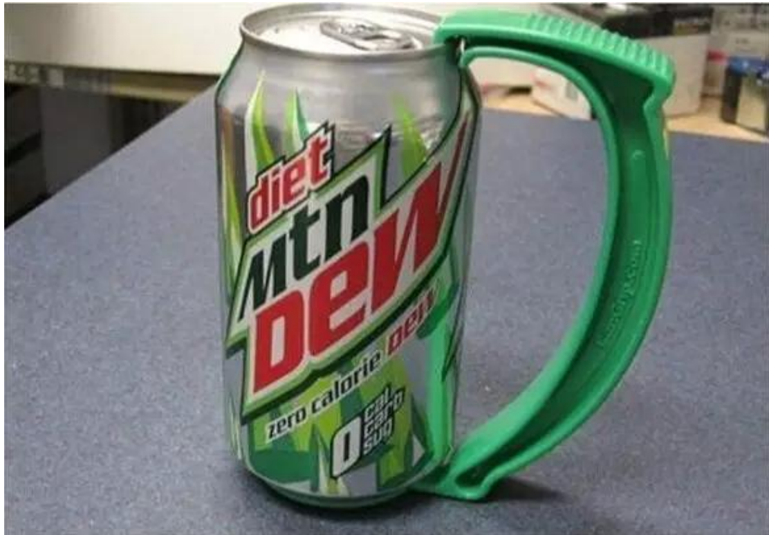
低调便捷的易拉罐手柄，这样喝饮料绝对有逼格。